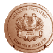
La catégorie "Excellence"