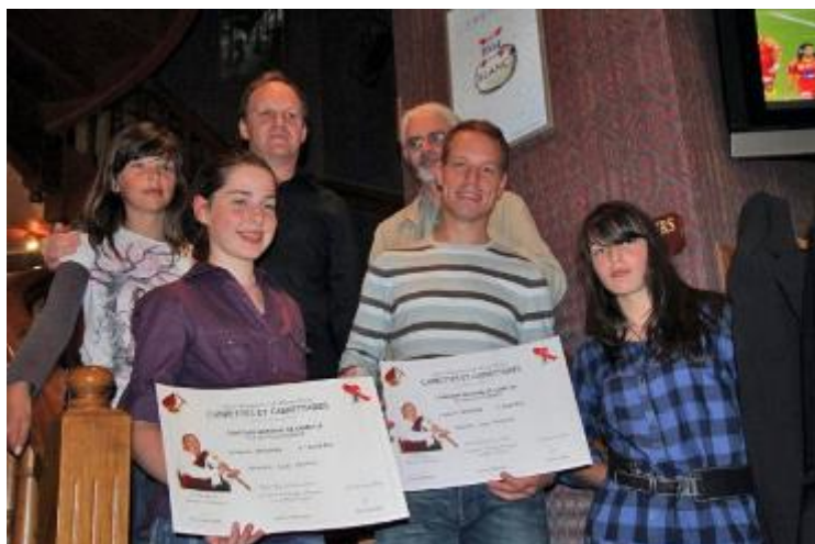
La catégorie "Initiation"