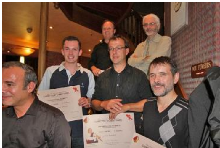
La catégorie "Confirmé"