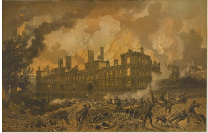
Hôtel de ville

Vous avez dit que le tribunal brûle ? Vous voyez le tribunal, lorsque l'on se met face à lui qu'est-ce qui dépasse ? La flèche de la Sainte-Chapelle. Et ce jour-là, la Sainte-Chapelle est entourée par les flammes et par miracle elle échappe au feu qui se répand dans Paris.